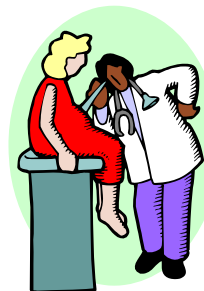
Servicios de Maternidad