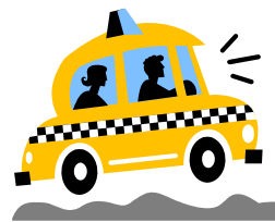
Transporte a servicios de salud