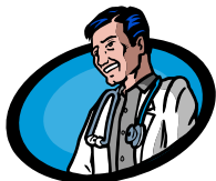
Citas con el Doctor