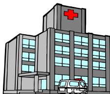
Sala de Emergencia y el Hospital