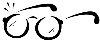
Servicios de la Vista