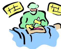
Cirugías y Procedimientos